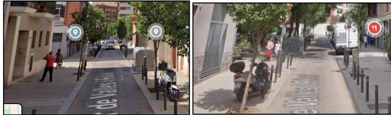
Google Maps, juliol del 2024, altres motocicletes al mateix carrer

Arran de queixes anteriors, aquesta Sindicatura ja ha estudiat en profunditat la problemàtica que suposa la presència de motocicletes damunt les voreres de la ciutat: la conclusió és que la ciutat pateix un excés de motocicletes estacionades a la vorera, i massa sovint, com en aquest cas, es fa infringint la normativa.