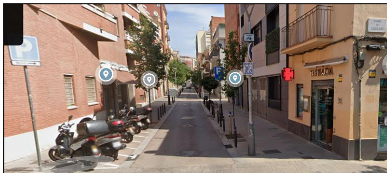
Google Maps, zona reservada per a l'estacionament de motocicletes

Al principi del carrer, en el seu encreuament amb el carrer de Garcilaso, cal destacar que hi ha una zona reservada per a l'estacionament de motos.