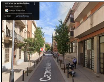
Google Maps, juliol del 2024, mateixa motocicleta carrer