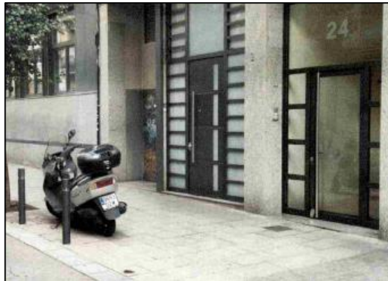
Fotografia de la motocicleta en infracció que ha aportat el promotor de la queixa.

D'acord amb la configuració de l'emplaçament, és evident que la motocicleta està estacionada en infracció.