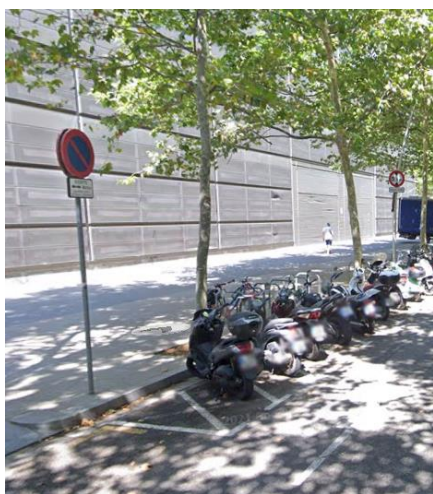
Inici zona motos (Llacuna, 129-135) Lloc d'estacionament del vehicle denunciat