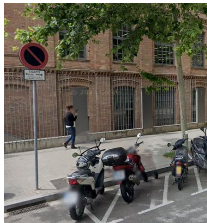
Final zona motos (Llacuna, 127)