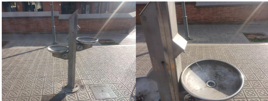
Revisió 15 de febrer de 2023

En data 15 de febrer de 2023, es va fer una nova inspecció de la instal·lació i es va comprovar que funcionava correctament: