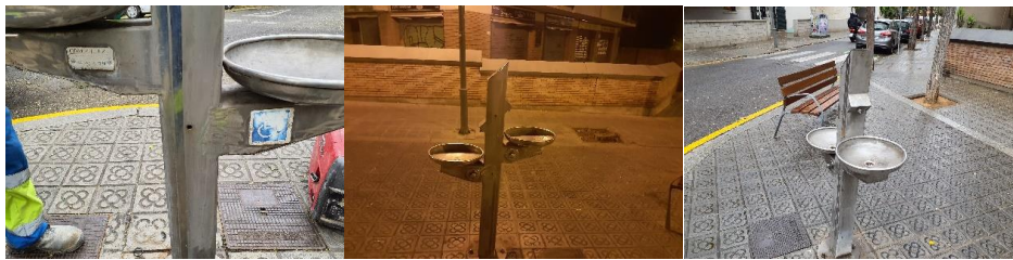
Revisió 25 de juliol

S'ha revisat la instal·lació trimestralment i no s'ha detectat que funcioni malament a cap de les inspeccions. Les revisions es van fer en dates 25 de juliol, 31 d'octubre i 28 de novembre de 2022.